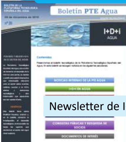
Newsletter de I+D+i en el sector del agua