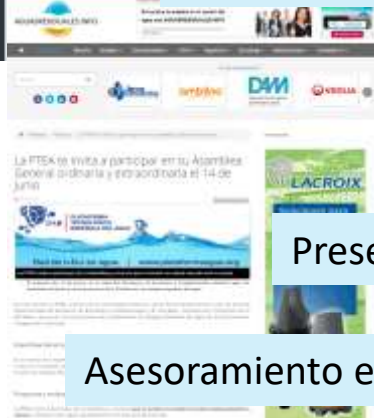
Presencia en medios de comunicación