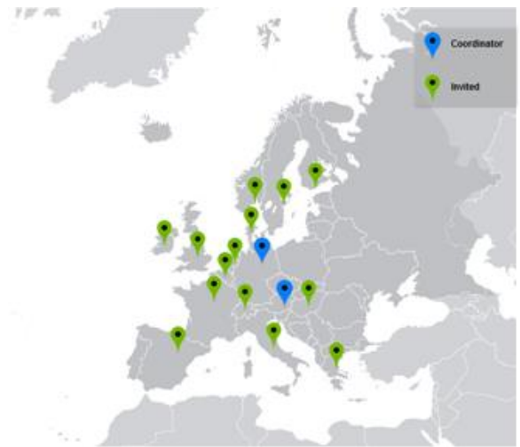
Figura 3. Más de 60 centros de Excelencia en Big Data de 17 países integran ya la red impulsada por Know-Center con el apoyo político de Austria y Alemania