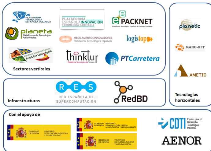
Figura 6. Agentes y sectores presentes en la plataforma.