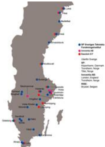
Figura 4. Cobertura de la iniciativa RISE en Suecia

Como puede verse, existe una gran diversidad de iniciativas centradas en Datos y particularmente en los retos asociados a Big Data en Europa. En unos casos hablamos de iniciativas más académicas y en otros de plataformas más industriales, regionales o nacionales, pero en todos los casos con la ambición de crear un ecosistema de innovación abierto que permita la generación de conocimiento en Big data y su transferencia a casos de uso industriales en uno o varios sectores. Algunas involucran actividades educativas; otras no. Algunas tienen fondos públicos directamente asociados a sus proyectos; otras no. En todos los casos, aunque este documento expone un número reducido de iniciativas, hemos confirmado el interés por establecer vínculos con otras iniciativas a nivel europeo y fomentar la colaboración entre ellas.